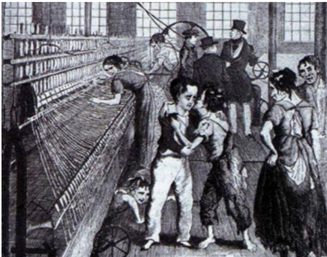
19世纪英国一家棉纱厂里的童工