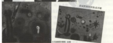
尝试把图形转成浮雕