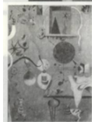
米罗的自爱（泥稿） （本图引自《米罗作品全集》第1卷第10页）