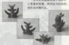
利用废旧材料制作的米罗

浮雕与雕塑不同，其前后、左右、上下的各个部分均要求塑造，使观者可以从作品的四周进行观察与欣赏。