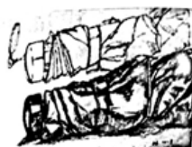
同样是用线条描绘，下部的伞表现得很有体积感。