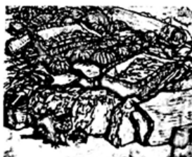
速写 现代 李涛