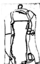
轻柔纤细的线条表现了衣服的质感。