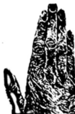
手(素描)现代 阿利卡(以色列)