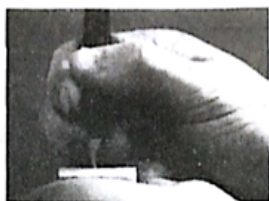
▲执刀如同执笔，一般是无定法的。如同执拿钢笔方式即可。