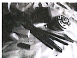
▲篆刻刀是主要工具，一般都用平口刀。磨印石一般可备粗细水砂纸各一张。用材有印石、印泥、笔墨、纸张等。