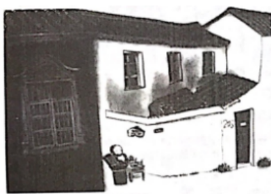
绿城（水彩）学生作品