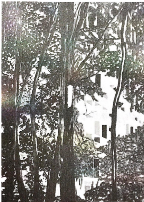
林中的小屋（油画）1994彼得·德·拉·海耶（英国）

枝叶清晰的深绿树从中透出白色的水泥公寓，轻盈的笔法描摹出房屋密集的窗户，形成了有趣的反差。