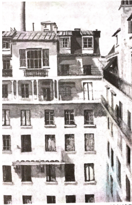
六月的小区（油画）1983阿利卡（以色列）

当房屋一栋栋增加以后，绿树便逐渐减少。这幅画中暖色的光影笔触强化了阳光直射的感觉。我的家在城市的中心，到处是密集的楼群。来找我的家，像穿越迷宫，就像这幅画里，房屋都一模样。可是，听老人们说，过去的房子跟今天的房子大不一样。