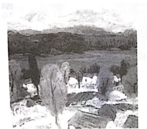
蔚蓝色的江南风景（油画）2001沈行 爷爷奶奶的家在美丽的江南水乡，钴蓝的色调传递出水乡的滋润。