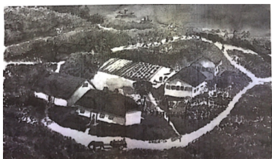
小巷人家（水墨画）1992李娜

山野坡地上植物环抱的家园，给我们带来写生的灵感；水色丰沛的笔触，点面错落的画面，体现了我们描绘的激情。