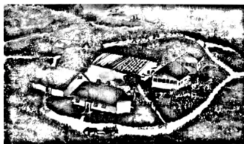
幸福家园（水彩）2012学生作品

山野坡地上植物环抱的家园，给我们带来写生的灵感；水色丰沛的笔触，点面错落的画面，体现了我们描绘的激情。