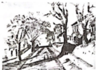
宁静午后（素描）学生作品