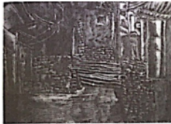
古镇小巷（素描）学生作品