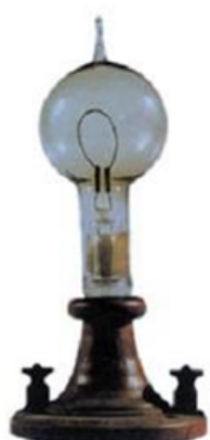
爱迪生发明 的白炽灯

第一次工业革命后，欧美国家实现了初步的工业化，促进了世界市场的初步形成，大量积累的资本为新工业部门的创建和崛起提供了充足的资金。科学技术的突破性成果和创新，直接推动了第二次工业革命的兴起。1866年，德国工程师西门子发明了世界上第一台大功率发电机，标志着第二次工业革命的开始。1879年，美国人爱迪生发明了电灯，以后他又改进了贝尔发明的电话，试验电车成功，发明了留声机。电最为新能源逐步应用于工业、照明及城市公用事业等领域，解放了生产力，促进了生产过程的机械化、自动化，开辟了电气时代。