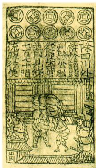
北宋纸币铜板拓片

然宋之所以得行者（纸币流一界（一个批次），备本钱三十六万缗，而又佐之以盐酒等项。盖民间欲得钞，则以钱入库；欲得钱，则以钞入库；欲得盐酒，则以钞入堵务。故钞之在手，与见（现）钱无异。