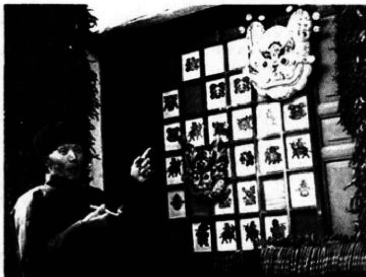
年节时,庄户人家窗格里贴着窗花,窗上挂着泥塑虎头挂片(陕西)