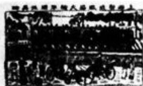
上海新造铁路火车开往吴淞(桃花坞年画)