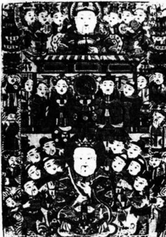
赐福生财灶王(山东杨家埠年画)

这是一幅三段式的灶王图。上层为赐福财神和童子;中层为灶王夫妇和侍从;最下层为宅神,两边为文官、武将和侍从。最下边有聚宝盆和鸡犬。加上画两侧的八仙人物,全图共32人,画面层次丰富,构图饱满,装饰性很强,同时体现了多子多福的吉祥寓意。