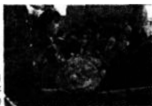
民间婚嫁用 面花陪嫁 (陕西合阳)