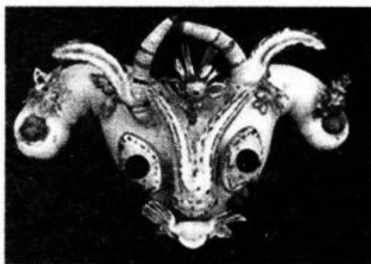
牛牯门(外婆为外孙满月赠送的礼物) 陕西面花

(2)木雕:民间木雕多为建筑装饰,如门、窗、梁、柱、飞檐等;家具装饰,如雕花床和雕花桌、椅和洗脸架等;祭祀用具,如土家族有虎图腾崇拜风俗,要在堂屋香龛上供奉木雕小虎,西南少数民族作为祭祀用具的木雕有面具、镇墓木雕和寒桩等,祭祀木雕风格粗犷,具有神灵崇拜的原始色彩。