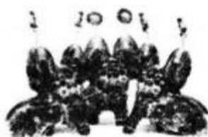
空虎 (陕西凤翔 泥玩具)