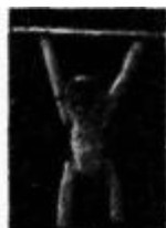
猴子翻杠 (北京绒布玩具)