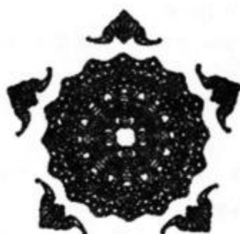
五福捧寿(宁夏回族团花剪纸)

各类带有寓意性的和象征性的刺绣图案体现着作者不同的创作意图。如:福、禄、寿一类的图案和纹饰是祝福老人长寿安康的,而给小孩的,常选用五毒图案以辟邪,保佑其健康平安,或用虎的图案,既能让虎的威严护佑儿童,也寄希望儿童成长得像虎一样健壮威武。如果是结婚用的,则选用麒麟送子、连生贵子、鱼戏莲、鸳鸯等图样,寓意婚姻吉祥美满,希望宗族传承