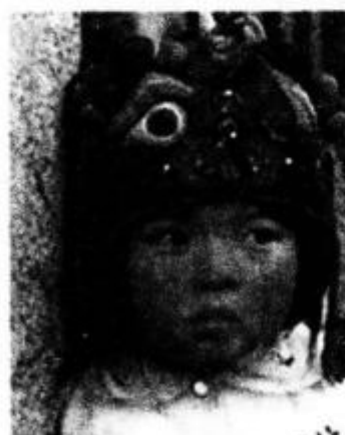
头戴虎头帽的陕西女娃

人生礼仪是人一生中具有重大意义的转折时的民间习俗。如诞生礼,包括满月、百日、周岁等。有些地方外婆要给孩子赠送亲手缝制的虎枕、虎鞋、虎帽和五毒围涎等,亲友们还要赠送面花。婚礼是人生中最重大的喜庆礼俗,各民族姑娘们要为自己的婚礼制作各种民俗规定的工艺品。如给自己织、绣衣裤,给未婚夫秀鞋鞋垫、钱包、烟荷包等。从订婚到结婚,民间礼仪热闹纷繁。新房用大红剪纸装饰得喜气洋洋,被褥、帐帘等都有丝绣图案装饰。这类婚礼民间美术品多有祝福吉祥、寓意夫妇和美、祈望早生贵子等含义。