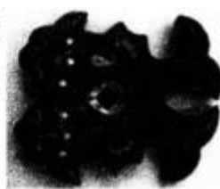
双鱼耳枕 (陕西刺绣)

料捏塑的摆设于几案上的艺术品,题材多为神话、历史、曲艺故事中的人物造型。“泥人张”、“面人汤”是著名的民间艺术家。