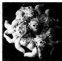
五娃争首 (山西面塑)