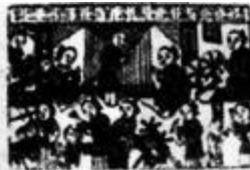
女十忙(山东杨家埠年画)