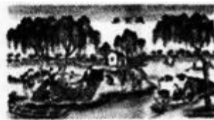
渔家乐(天津杨柳青年画)

纸剪出形象后,用需要的颜色点染而成。套色剪纸是用不同的颜色根据不同的装饰部位剪制套色而成,形成五彩缤纷的效果。剪纸精细的如春蚕吐丝,繁而不乱,粗犷的如大刀阔斧、简而不陋。