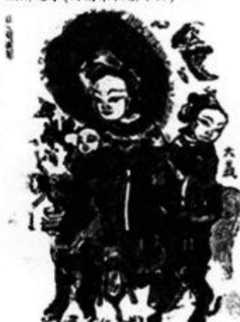
麒麟送子(河南朱仙镇年画)