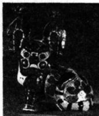
空虎(陕西凤翔泥玩具)

(3)布玩具：用布做外壳的软雕塑，多为动物造型，上面饰有布贴花、桃花、绣花或手绘画，造型憨态可掬、稚拙可爱。如布老虎，凶猛的老虎被塑造得像孩童般娇顽可爱。虎头鞋、虎头帽和各种动物形耳枕都是保佑儿童平安幸福的吉祥物，是集玩具、观赏与实用