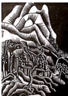
林中小屋（黑白木刻）（现代）王劼音

的苍劲古朴都具有鲜明的趣味特色，无论是刻点刻线都可以自由发挥，放刀直刻。但要注意木刻中的黑白灰构成关系是重要的艺术语言，要学会运用黑与白的强烈对比效果，还要知道重复的点与线能构成画面中的灰色调。木刻中的这种黑白灰构成变化无穷，具有独特的艺术美感。