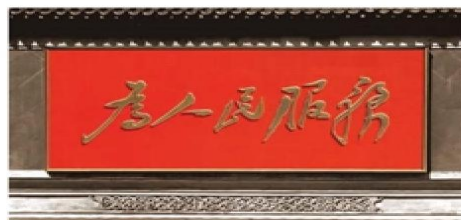
中南海新华门影壁上刻着的“为人民服务”

坚持为人民服务的工作态度。政府及其工作人员要牢固树立为人民服务、真心实意对人民负责的思想，为人民谋利益。政府工作人员在执行公务过程中，必须深入群众，关注民生，体察民情，尊重民意；不能损害人民利益，违法失职行为要受到追究。